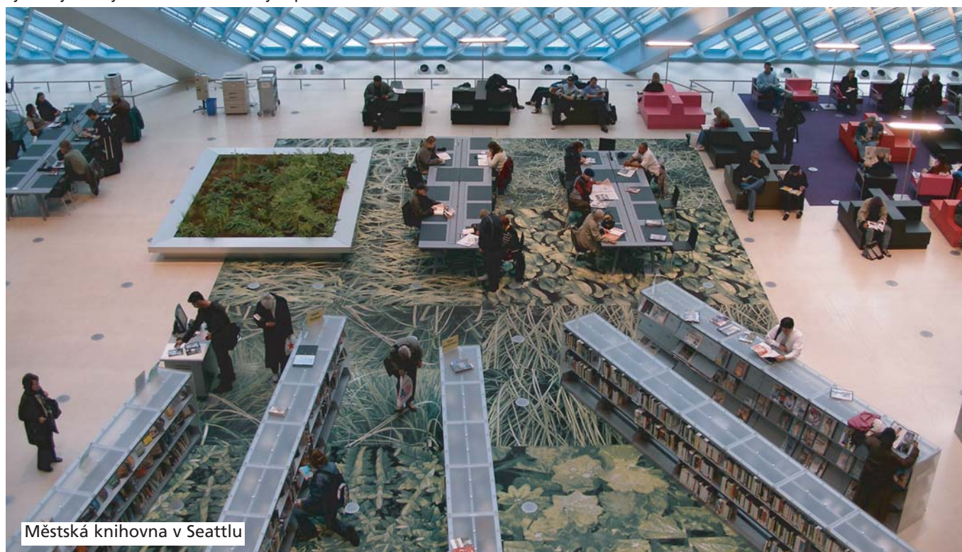
Městská knihovna v Seattlu

Nová budova Národní knihovny ČR bude moderním multifunkčním prostorem, který nabídne všem návštěvníkům možnost setkat se v příjemném prostředí s kolegy či přáteli a/nebo navštívit některou z kulturních akcí. Svým uživatelům knihovna zpřístupní kromě milionů dokumentů ve svých vlastních sbírkách další stovky milionů dokumentů a informací z celého světa. To vše v diferencovaně členěných i vybavených zónách - od volných prostor