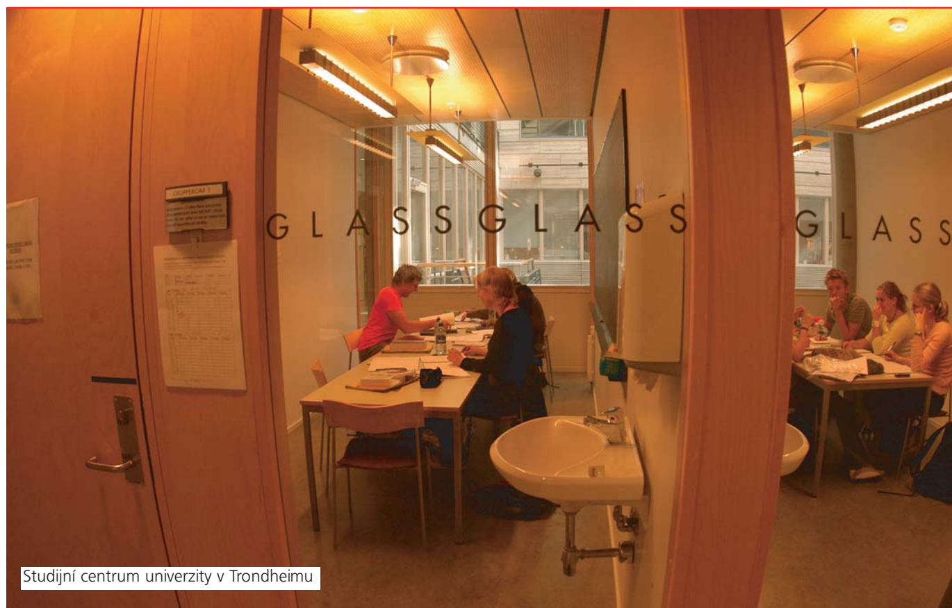
Studijní centrum univerzity v Trondheimu

Kromě možnosti občerstvení v místní restauraci i kavárně nabídne nová knihovna i dostatek prostor pro alternativní sezení a relaxaci.