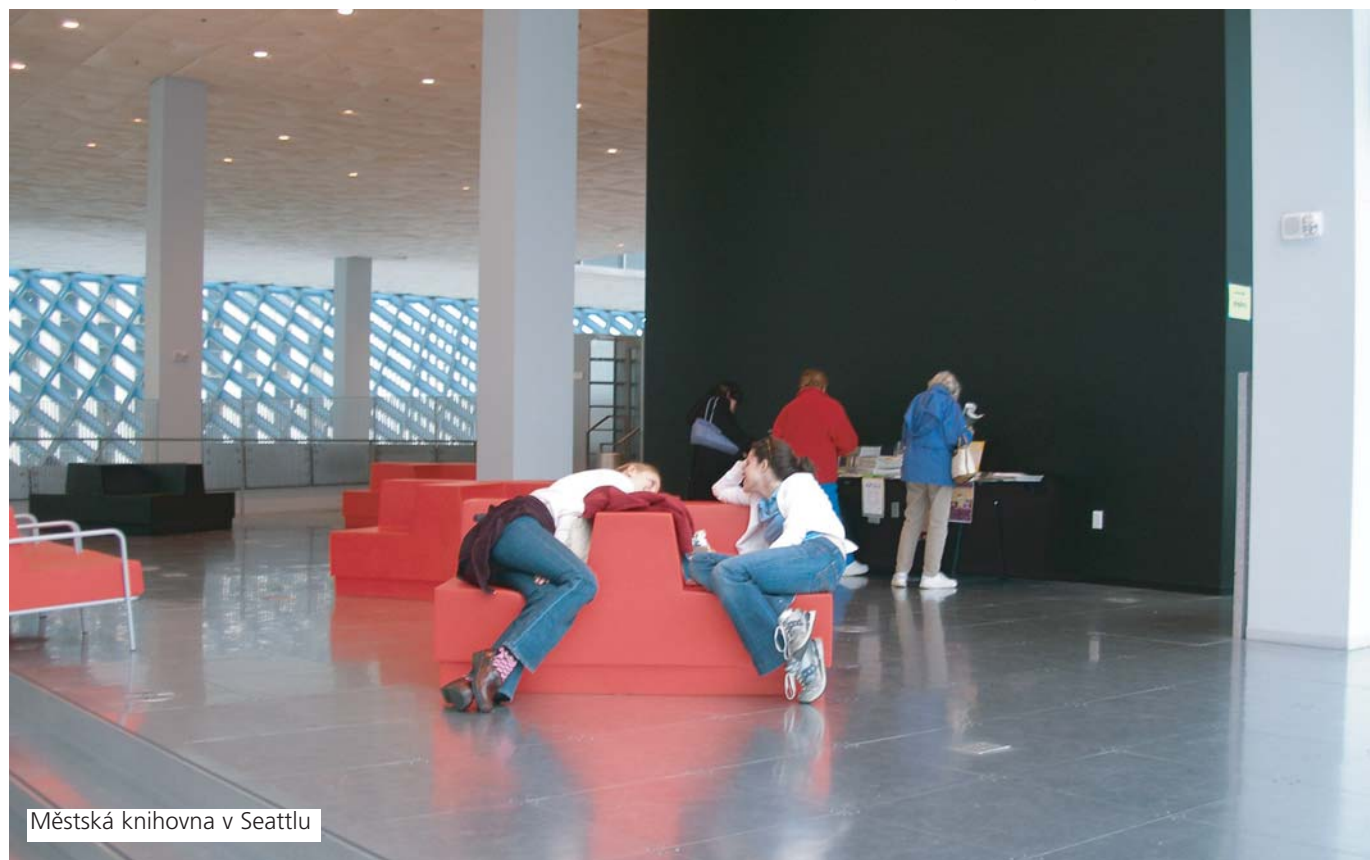
Městská knihovna v Seattlu

Kromě možnosti občerstvení v místní restauraci i kavárně nabídne nová knihovna i dostatek prostor pro alternativní sezení a relaxaci.