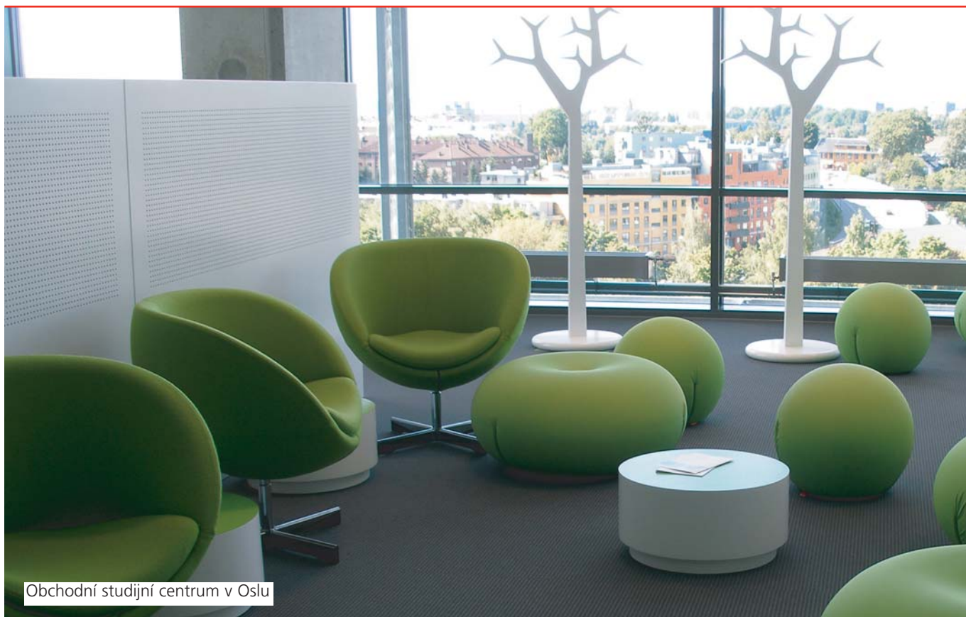
Obchodní studijní centrum v Oslu