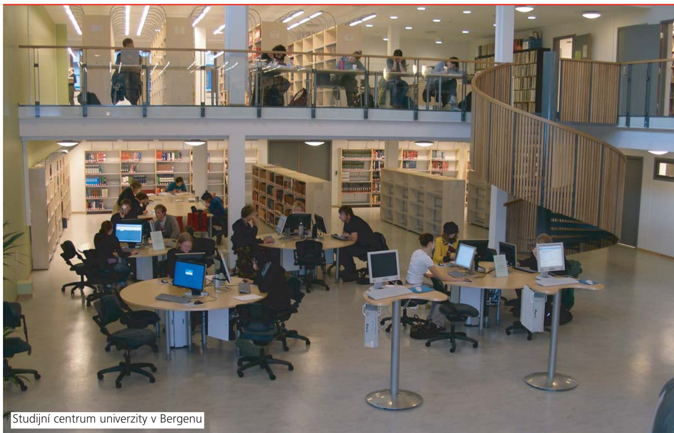
Studijní centrum univerzity v Bergenu

přes částečně oddělené prostory pro týmovou práci