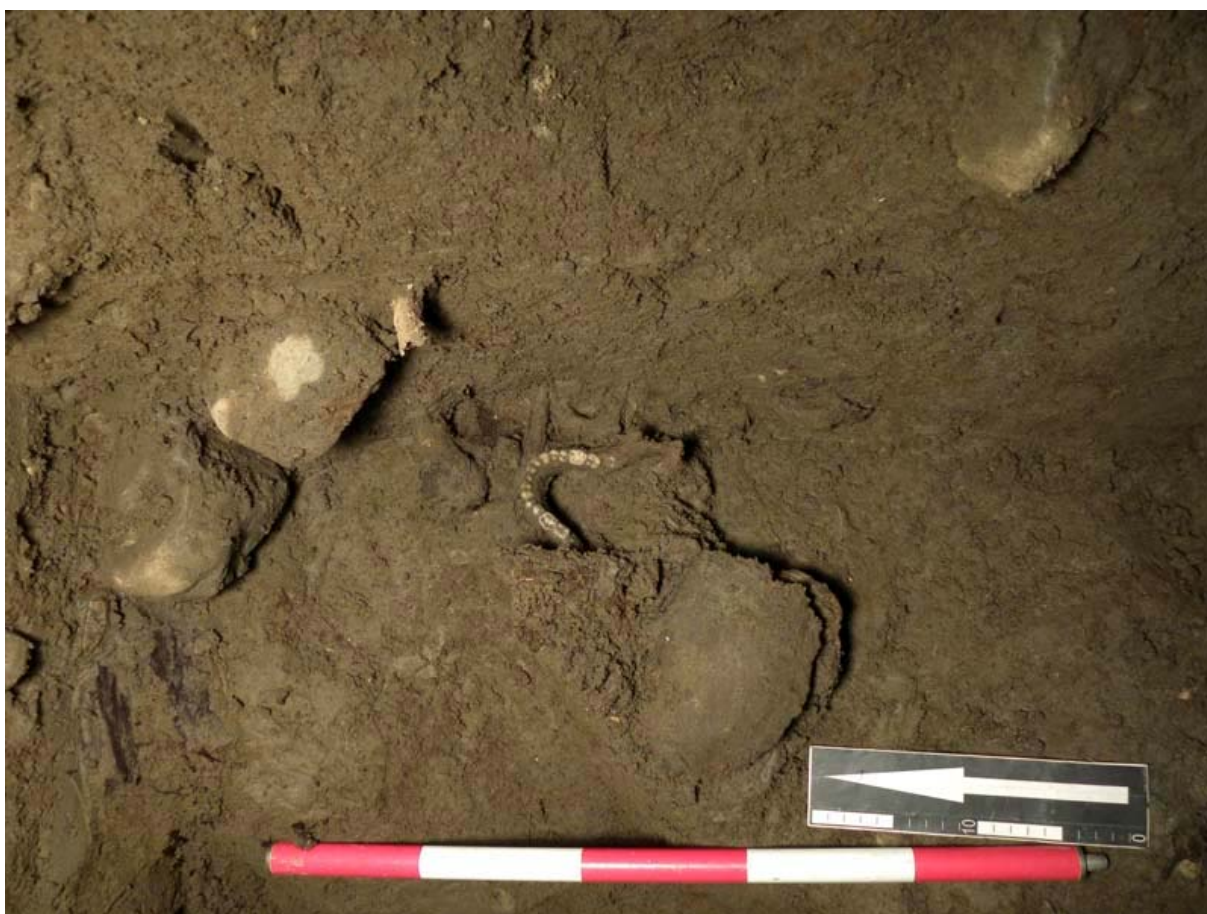
5. Torzo narušeného raně středověkého hrobu nalezeného na Mariánském náměstí. Pohřebiště bylo nalezeno při ražbě štoly vyvolané rekonstrukcí dešťové kanalizace Klementina.