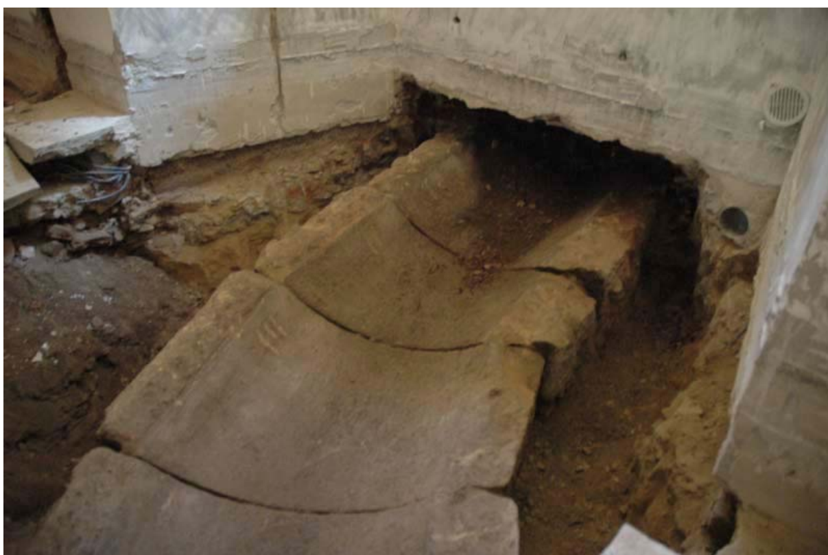
7 - 8. Pod knihovnou byla objevena nejstarší dochovaná kanalizace v Praze. Její původ se odhaduje na rok 1660.