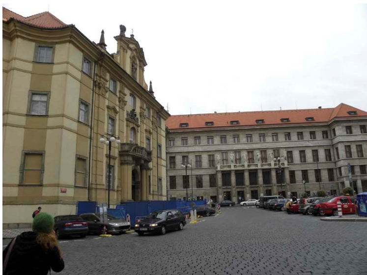
1. Mariánské náměstí. Ve stavební ohradě před východním průčelím Klementina probíhal v roce 2010 archeologický výzkum, vyvolaný stavebními pracemi v rámci 1. etapy revitalizace Klementina.