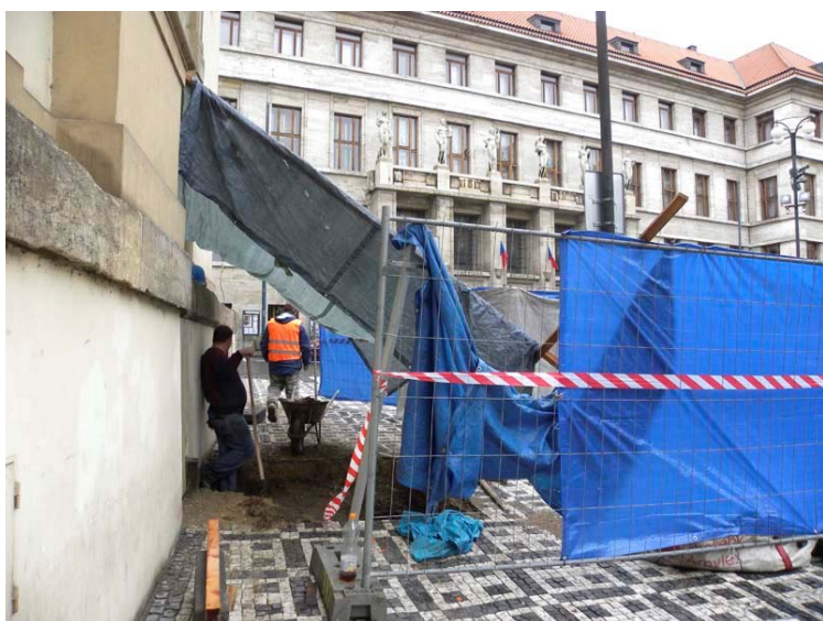
2. Mariánské náměstí. Ve stavební ohradě před východním průčelím Klementina probíhal v roce 2010 archeologický výzkum.