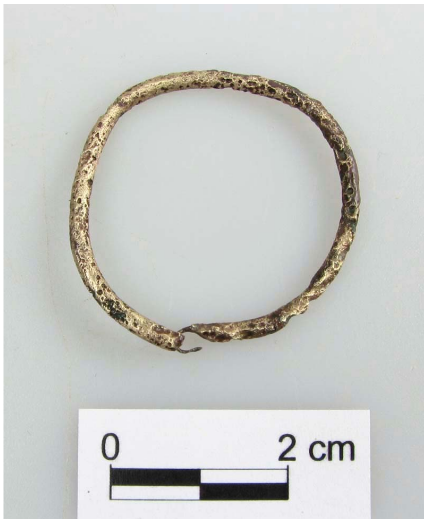
6. Bronzová záušnice nalezená v jednom z hrobů.