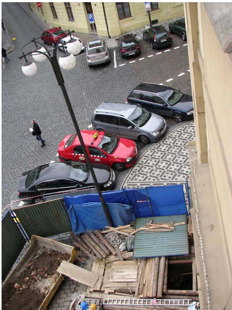
3. Mariánské náměstí. Ve stavební ohradě před východním průčelím Klementina probíhal v roce 2010 archeologický výzkum. Dole vstupní šachta, ze které byl při rekonstrukci kanalizační přípojky ražen tunel pod plochu náměstí. Při ražbě bylo objeveno středověké pohřebiště.